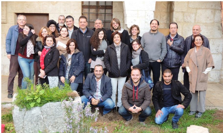
Journée au vert– Ajeltoun Décembre 2015