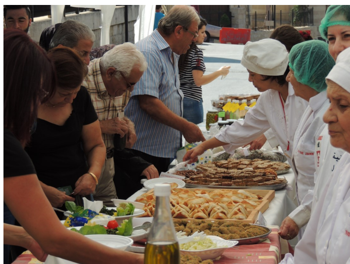
Les fêtes des Fair Trade Towns sont également un bon moment de partage autour d'excellents buffets préparés par les femmes de chaque village. Ici à Ain Ebel le 17 octobre 2015.

Mheidthé dans le sud de la plaine de la Bekaa était le premier village à organiser son événement des Fair Trade Towns le 7 juin 2015. Les habitants et participants ont été honorés de la présence de l'initiateur du mouvement des Fair Trade Towns, M. Bruce Crowther, qui a spécialement fait le déplacement depuis Gars-tang au Royaume-Uni.