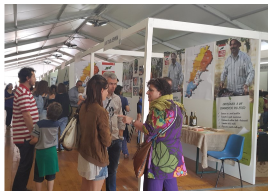
Stand Fair Trade Lebanon lors de la foire de Milan – mai 2015