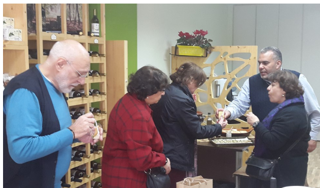
Dégustation de recettes à base de keshek lors du « Keshek day » à la boutique « Terroirs du Liban » à Hazmieh le 2 février

L'équipe de Fair Trade Lebanon a organisé cette année la première édition du « Keshek Day », événement qui vise à faire découvrir ou redécouvrir le large panel de recettes traditionnelles à base de « keshek ». Ce fut l'occasion de promouvoir la production de la coopérative de Aita el Fokhar, partenaire de longue date de FTL pour les produits laitiers. Près d'une centaine de personnes sont passées tout au long de la journée à la boutique et ont ainsi pu découvrir l'ensemble de la gamme de la marque « Terroirs du Liban »