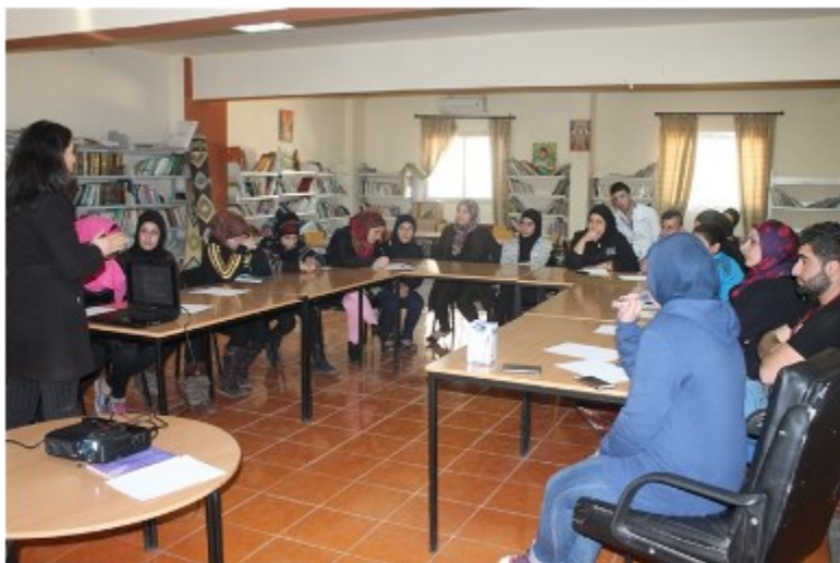
Formation sur la communication d'un comité mixte – Akkar 2014

Les activités développées dans le cadre du projet concernent différents domaines d'actions et ont pour but de répondre le plus finement possible à la demande locale. Ainsi dans le Akkar, Fair Trade Lebanon forme des femmes libanaises et syriennes à la gestion d'une coopérative, aux normes d'hygiène et aux principes du commerce équitable dans le but de créer une valeur ajoutée pour l'ensemble de la communauté. Dans les villages du Sud-Liban, l'action du projet consiste en la relance d'une coopérative de transformation actuellement à l'arrêt tandis qu'à Fourzol dans la Bekaa, le projet remédie en partie au problème des déchets en fournissant des bennes à ordures ménagères à la municipalité.