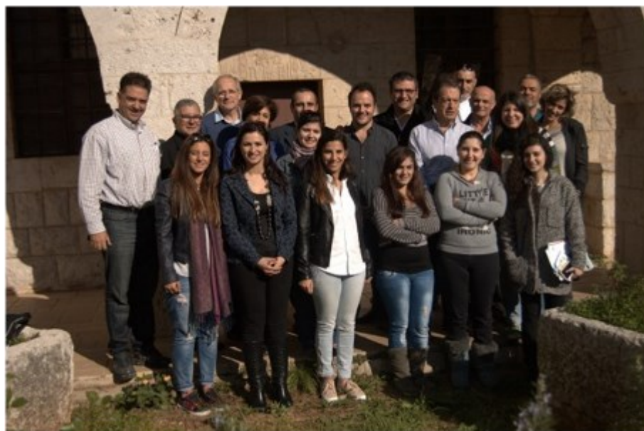
Journée au vert- Ajeltoun Novembre 2014