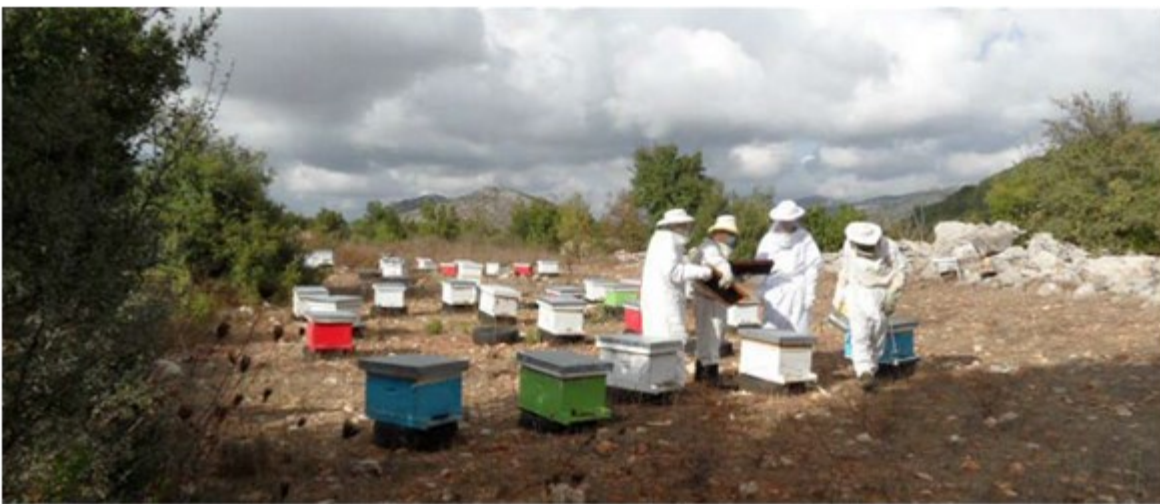
Rucher à Saidoun dans la région de Jezzine