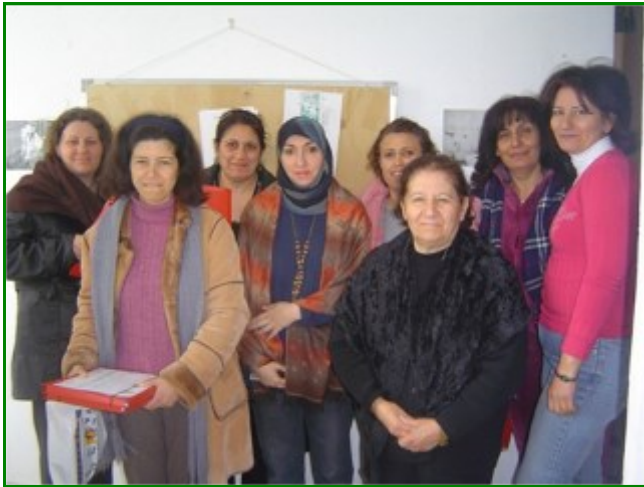
Lors d'une session de formation à la coopérative d'Aïn Ebel

Le premier atout dans la réussite du projet est sans nul doute le nombre de bénéficiaires directs et indirects concernés par les activités du projet. Quelques 500 membres des coopératives partenaires ont été directement touchés par le projet tandis que près de 3000 personnes ont assisté aux événements de sensibilisation organisés dans tout le Liban. Le projet a également bénéficié aux 2.500 membres des familles des bénéficiaires directs ainsi qu'aux 50.000 membres des communautés villageoises où des activités du projet ont été mises en place, là aussi réparties à travers tout le pays.