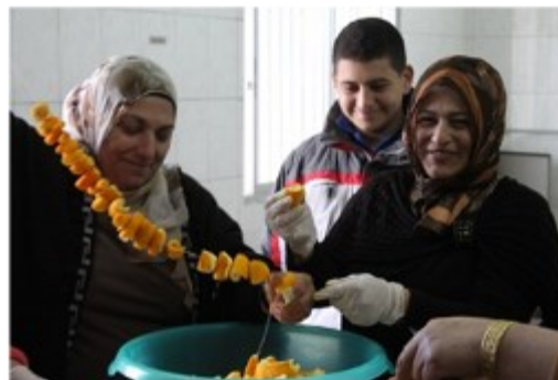
Echange de femmes syriennes et libanaises – Akkar 2014

C'est alors que 6 villages libanais, Hrar, Muchumuch et Fneideq dans le Akkar, Abra, Kfar Tebnit au Sud-Liban et Fourzol dans la Bekaa ont été sélectionnés pour accueillir les activités du projet. Les zones couvertes par le projet rassemblent 10 000 habitants dont 90 femmes travaillant dans des coopératives et 5 comités constitués de 10 personnes soit 50 personnes.