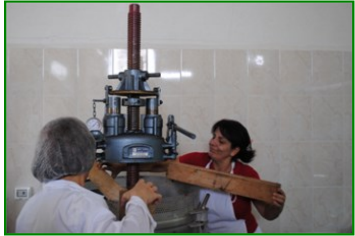
Utilisation d'une presse dans le Centre de Services Communs – Fourzol en automne 2014

Le Centre de Services Communs a été inauguré en juin 2014 dans le village de Fourzol dans la Bekaa et constitue l'une des pièces maîtresses du projet. Ce centre, équipé en machines de petite transformation agroalimentaire et de conditionnement, permet de répondre aux besoins des coopératives partenaires du projet pour la transformation de leurs produits, leur conditionnement ainsi que leur stockage. Le fonctionnement du centre est assuré par le personnel de la coopérative faitière du projet qui est hébergée sur place.