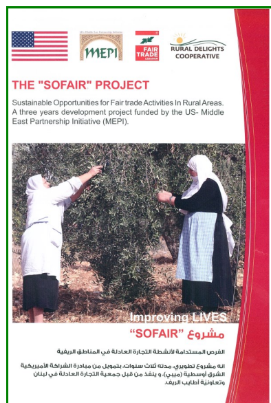
Brochure de présentation du projet à destination du grand public.

« L'objectif phare de SOFAIR est de promouvoir les produits du terroir libanais dans le cadre du commerce équitable, à savoir un concept qui va bien au-delà de la seule qualité du produit fini »