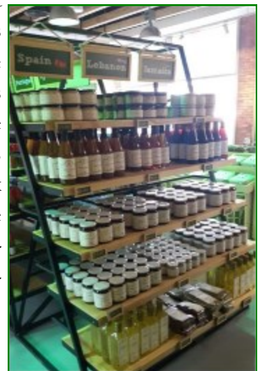
Présentoir de Fair Trade Lebanon à la boutique Farmers' Garden — Dubai

WFTO Africa et y représente désormais les producteurs du Moyen-Orient (Palestine et Liban). C'est également dans cette logique de fédérer les forces vives du commerce équitable dans la région que Fair Trade Lebanon a organisé en mai 2014, à Beyrouth, des ateliers d'échanges sur l'évolution des pratiques dans le secteur. Ces ateliers ont réunis les principaux acteurs du commerce équitable du monde arabe et méditerranéen. Les quelques 300 membres des organisations étrangères participant à ces rencontres ont été sensibilisés aux activités du projet. Cet activisme de Fair Trade Lebanon sur la scène régionale dans la promotion du commerce équitable et de ses activités, participe à l'amélioration des conditions de vie des producteurs des régions défavorisées du Liban.