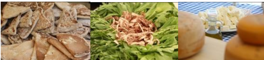
Produits du terroir libanais proposés lors du brunch équitable aux Souks de Beyrouth le 12 mai 2014

Le projet accomplit également un important travail d'identification et d'évaluation de la chaîne de valeur des produits ayant un potentiel d'accès aux marchés du commerce équitable et biologique. C'est notamment dans ce cadre que Fair Trade Lebanon a réalisé deux études sur la chaîne de valeur de la grenade et de l'olive, deux produits phare des régions du Akkar et de Donnieh.