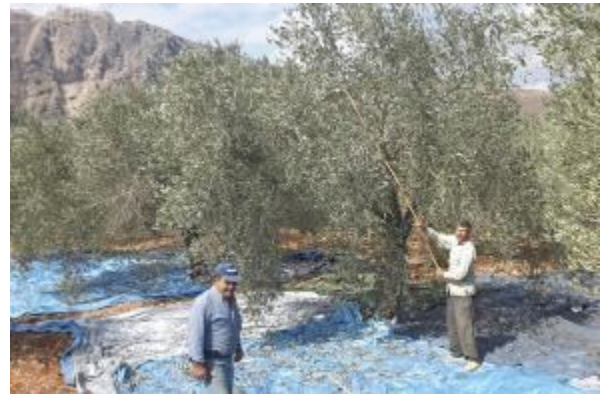
Récolte des olives (certifiées biologiques) à Qleyaa en octobre 2014

22 groupements de production partenaires de FTL à travers tout le Liban Soit environ 750 producteurs Dont près d'un tiers de femmes 85 produits libanais vendus dans la boutique de FTL 8 groupements dans le Nord-Liban et la Bekaa, 9 groupements dans le Mont-Liban 5 groupements dans la Sud-Liban