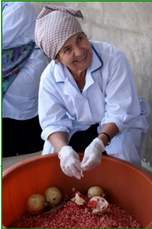
Préparation de la mélasse de grenade. Coopérative de Nejmet el Soboh à Mheidthé. Octobre 2014

Sur la base de ce constat, Fair Trade Lebanon développe depuis janvier 2013, et ce pour 4 ans, le projet intitulé « Le commerce équitable : un outil de lutte contre la pauvreté dans les zones rurales du Liban ». Cette initiative menée en partenariat avec la fondation Drosos vise à contribuer au développement économique, social et culturel de 500 producteurs dont un tiers de femmes des régions rurales les plus défavorisées du Liban.