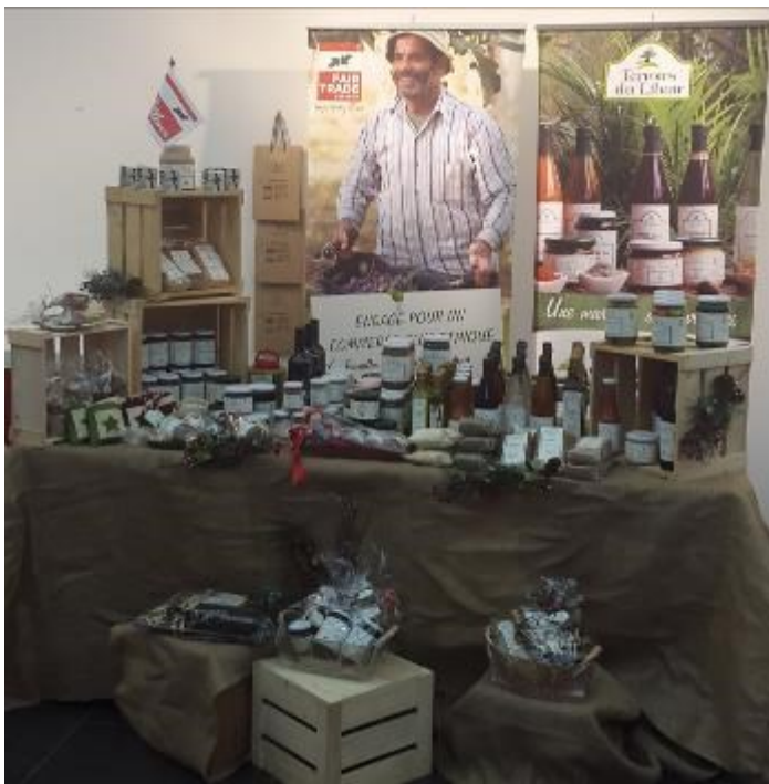
Stand de Fair Trade Lebanon lors de l'édition 2014 du marché de Noël de l'Institut Français de Beyrouth

En 2014 FTL a de nouveau pris part au marché de Noël de l'ambassade de France à Beyrouth. Ce type d'évènements est très important pour les ventes mais également pour la visibilité que ces derniers procurent auprès des consommateurs libanais. La présence de FTL à plusieurs marchés de Noël parfois de manière concomitante a nécessité une implication de toute l'équipe et ce tout au long de la période des fêtes.