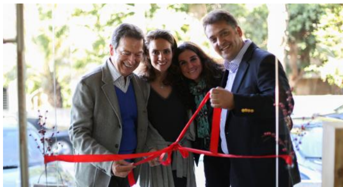
L'inauguration de la boutique en décembre 2013