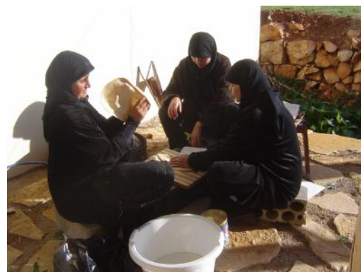
Des femmes de la coopérative de Kwekh (Hermel) préparent la pâte pour le saj