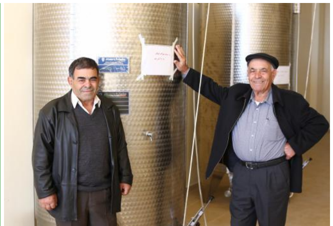
Des nouvelles cuves achetées pour la coopérative de Qleyaa

L'année 2014 devrait voir le lancement de la première campagne pour des villages du commerce équitable au Liban. FTL travaille sur le lancement de cette campagne afin de renforcer le commerce équitable au Liban et d'intégrer cette économie sociale aux dynamiques économiques du Liban. L'objectif serait de donner le titre de village de commerce équitable, déjà très répandu en Europe, à 10 municipalités libanaises et d'entamer avec eux un travail sur le développement de l'économie locale, du commerce équitable tout en renforçant la coopération entre acteurs économiques de leurs villages.