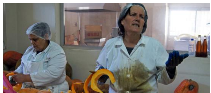
Des femmes de la coopérative de Fourzol préparent des citrouilles