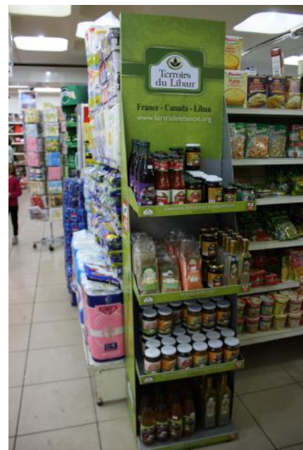
Un stand dans un supermarché