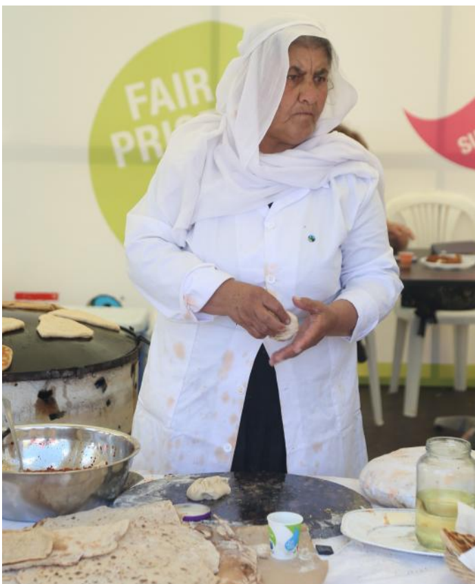
Une femme de la coopérative de Wadi el Taym (Rachaya) pétrit la pâte avant de la faire cuire