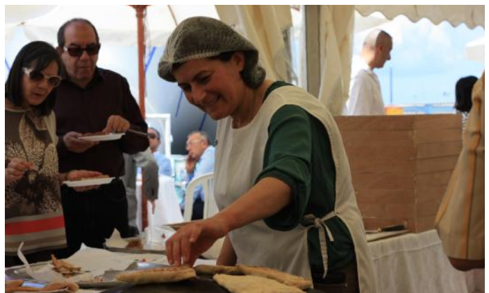
La préparation de fatayers au saj traditionnel par une femme de la coopérative de Baskinta (Metn)

La Journée Mondiale du Commerce Equitable a permis de célébrer l'octroi du premier titre « village du commerce équitable » au Liban (Baldat al-tijara al-adila) pour Menjez, dans le Akkar. FTL prévoit en outre de donner le titre de village du commerce équitable à 10 municipalités libanaises d'ici 2015.