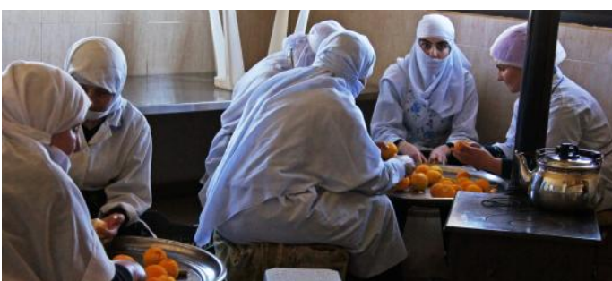
Des femmes de la coopérative de Mheidthé épluchent des oranges