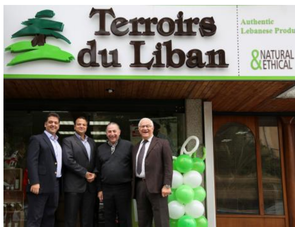
La boutique Terroirs du Liban lors de son inauguration