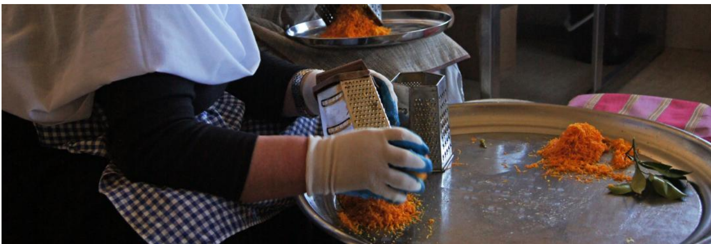
Oranges amères râpées, Coopérative de Mheidthé (Rachaya)